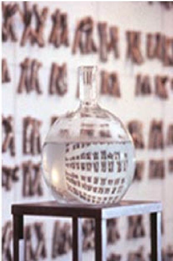
Abb. 01: Suzanne Anker, Zoosemiotics (Primates) (1993)

ritte von Erich von Tschermak verfasst. 14 Vries, Correns und von Tschermak hatten ‚unabhängig‘ voneinander die von Gregor Johann Mendel in der zweiten Hälfte des 19. Jahrhunderts formulierten Vererbungsgesetze ‚wiederentdeckt‘ 15 . Mendels Originalschrift hatte wenig Aufmerksamkeit auf sich gezogen, ganz im Gegenteil zu den drei Schriften aus dem Jahr 1900, deren Erscheinen mit der Entdeckung des Wirkungsquantums durch Max Planck im gleichen Jahr korrespondierte. Diese drei Aufsätze bewahrten nicht nur Mendels Gedanken zur Vererbung vor dem Vergessen, sondern legten darüber hinaus die Grundlagen jener neuen Wissenschaft, 16 die bald darauf ‚Genetik‘ genannt wurde und sich hundert Jahre später zur Leitwissenschaft der Zivilisation aufschwingen sollte.