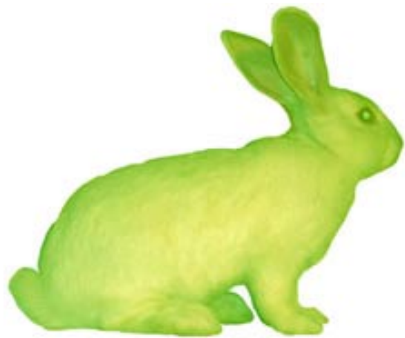
Abb. 10 Eduardo Kac, Bunny 2000 (2000)

In der Installation Genesis (Abb. 8) versucht Kac, biologische Prozesse und Verfahren einer Technologie sichtbar zu machen, die in den Forschungslabors seit Jahren zum Alltag gehören. In einem abgedunkelten