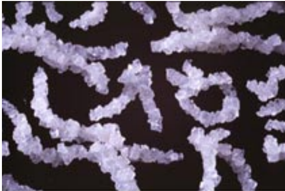
Abb. 03: Suzanne Anker, Sugar Daddy: The Genetics of Oedipus (1992)