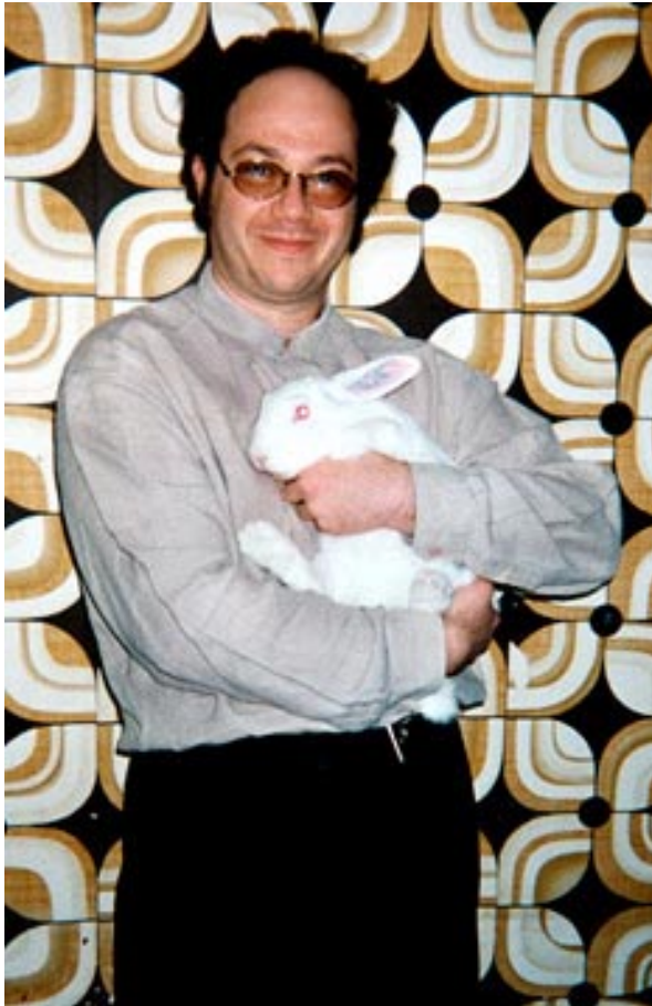
Abb. 11 Eduardo Kac, Eduardo Kac mit Bunny 2000 auf dem Arm (2000)

terien mit unterschiedlichen Spektraleigenschaften. Dieser Prozess, der sonst nur im kontrollierten Laborraum stattfindet, wird von Kac tatsächlich in den Galerieraum transferiert.