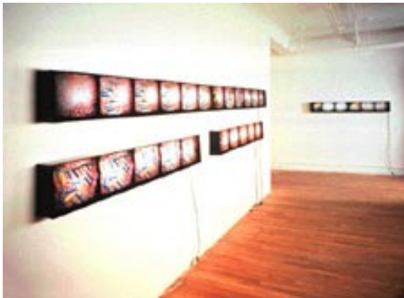
Abb. 07: Nell Tenhaaf, Species Life (1989)

Plexiglas gebannt und von einer Lampe beleuchtet. Die obere Reihe besteht aus zwölf rechteckigen Kästen, die ohne Zwischenraum und in Augenhöhe an der Galeriewand angebracht sind. Die Reihe darunter besteht aus zwei mal fünf solcher Gehäuse, unterbrochen von einer Leerstelle in ihrer Mitte. Das Motiv der Doppelhelix windet sich über die Einteilungen der Oberflächen der verschiedenen Rechtecke hinweg. Ein entscheidendes Moment in dieser Arbeit ist die Darstellung der Entwindung der beiden Stränge der Doppelhelix vor der Replikation. Wie Nagelgeschosse trennen sich die beiden DNA-Stränge und sprengen aus der Bildfläche heraus, zerreißen das Band des ‚Lebens‘ und laufen dem schönen Schein der vollkommenen Ästhetik der Doppelhelix zuwider.