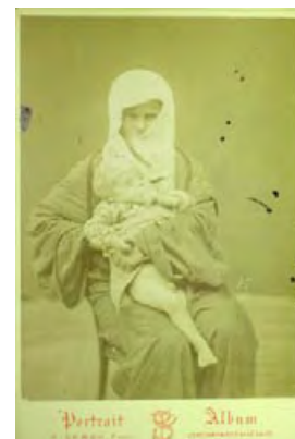
Pascal Sebah: Muslimin mit verwundetem Kind, Fotografie, 1877

Dr. des. Martina Baleva Berlin-Brandenburgische Akademie der Wissenschaften Interdisziplinäre Arbeitsgruppe »Bildkulturen« Jägerstraße 22/23 D-10117 Berlin Tel.: +49.30.20 37 05 74 Fax: +49.30.20 37 04 44 Email: baleva@bbaw.de