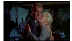
Screenshot aus »Vertigo«, Alfred Hitchcock, USA 1958