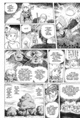
Seite aus Hayao Miyazakis „Nausicaä aus dem Tal der Winde“ (Hamburg 2002, B. IV, S. 82)